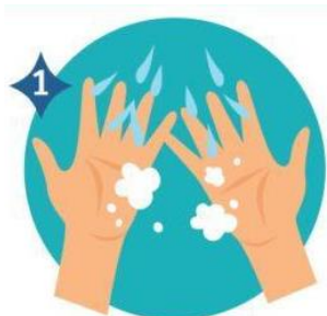
1 AGUA Y JABON

REALIZAR LAVADO DE MANOS ANTES DE COLOCARSE CUALQUIER EPP Y LUEGO DE RETIRAR LOS MISMOS