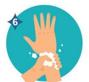
6 INCLUIR LAS MUÑECAS