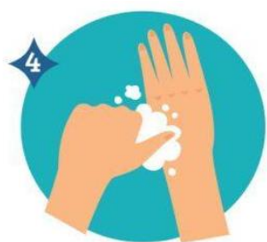
4 AMBOS PULGARES