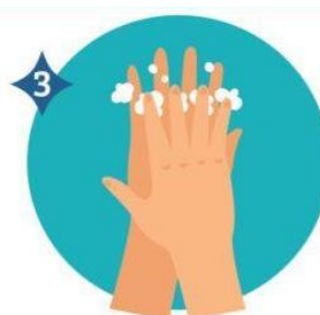
3 ENTRE LOS DEDOS