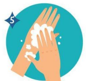
5 DORSO DE LAS MANOS