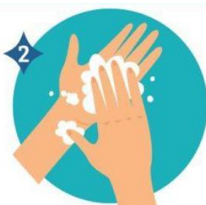
2 PALMA CONTRA PALMA